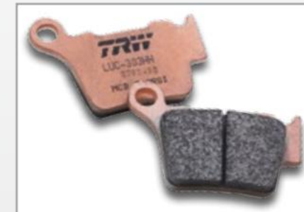
RSI SINTER OFFROAD

» profesionálna terénna pretekárska základňa » vynikajúci výkon » tepelne vysoko odolná » priama odozva