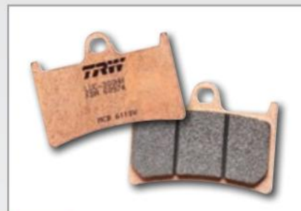
SV/SH SINTER STREET

» alliage pour offroad, skútre a vozidlá faiblement motorisés » level de prix très attractif » optimálny výkon après le rodage » bonne durabilité par temps sec, même hors route