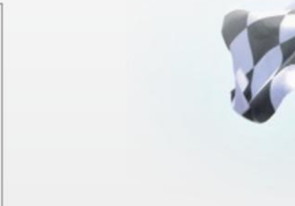
CRQ HYPER CARBON

» Športové plakety pre zábavu a SuperMotos » Kapacita priamej reakcie » Vyžaduje sa manuálna redukcia » très bonne capacité de freinage