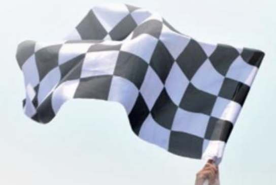
SCR SINTER CARBON

» plaquettes sportives éprouvées à base de carbone » technológia NRS permettant a point de poussée constante jusqu'à la limite d'usure » odolnosť plus élevée que celle des SRQ