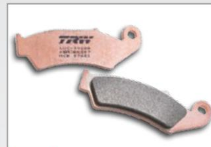
S.I SINTER OFFROAD

» špeciálny vývoj naliat' les gros skútre » dobré dávkovanie, kapacita voľnej výšky » aucun rodage particulier » komfortná a trvanlivá výška